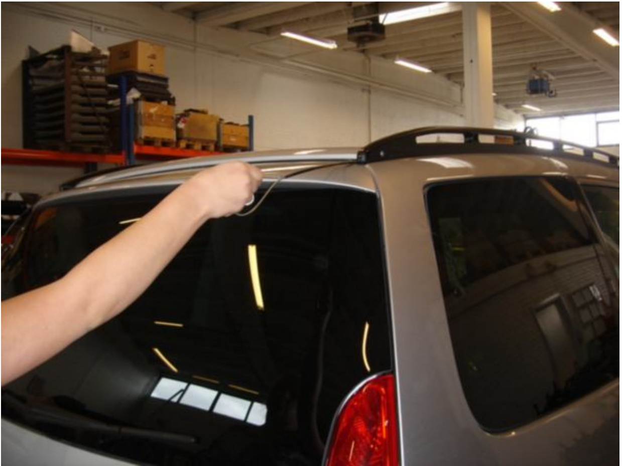
1. Tag udløserstroppen ud fra bagklappen og træk i den.