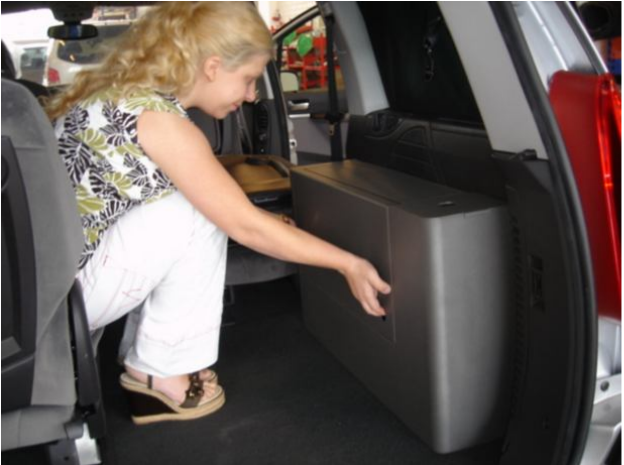
10. Betjening af køkkenet: Hiv op i begge huller i frontpladen. (Frontpladen er også bordpladen).